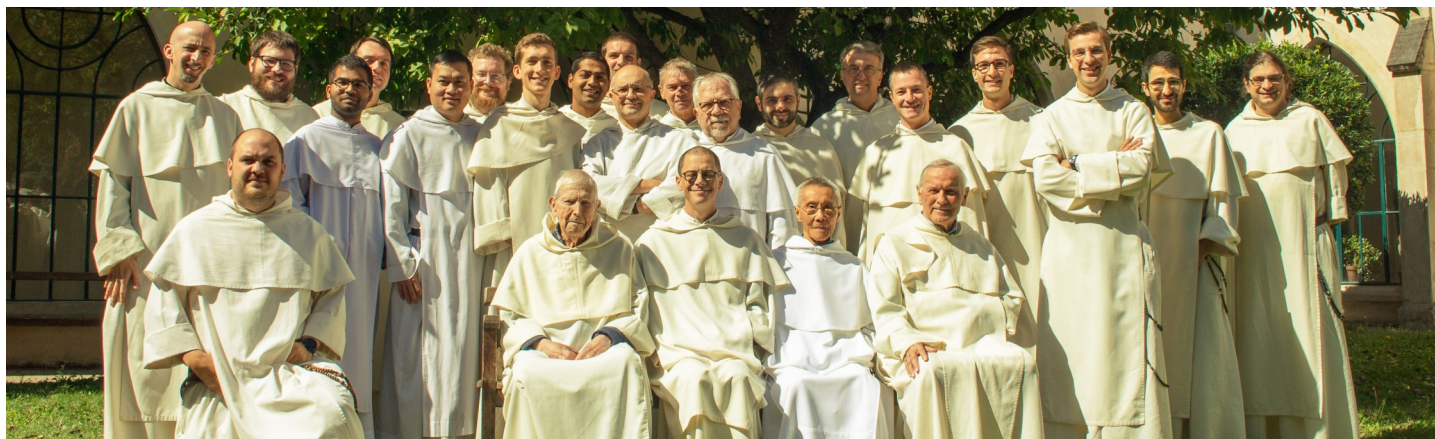
Le nouveau visage de la communauté des frères dominicains du Saint-Nom-de-Jésus